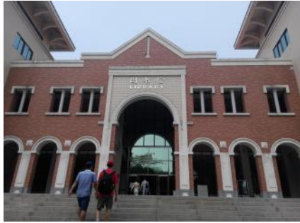
廈門大學圖書館 刷卡進入 自習位置採自行登記制