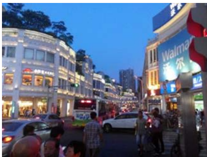
中山路 生活機能便利 遊客很多 消費較高昂