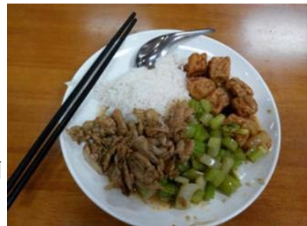
學校食堂 學生刷卡機制 非常便宜