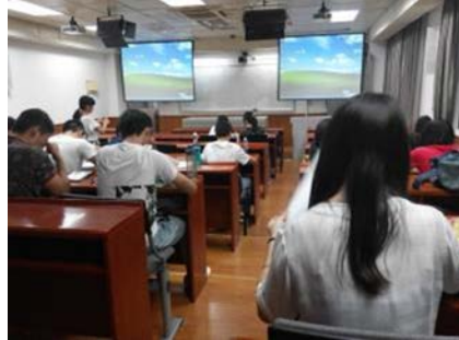
管理學院教室 設備良好