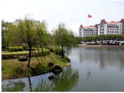
校園風光 遊客廈門必遊景點之一 廈大芙蓉湖