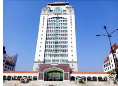
嘉庚主樓 辦理交換是事務地點 可從金門遠眺