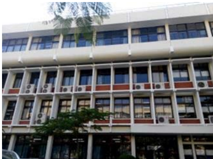
普通教學樓外觀 各科系與通識課程混用